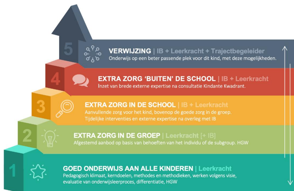
Figuur 1: Continuüm van Zorg

Basis van elke samenwerking binnen de school is het maken van goede samenwerkingsafspraken met externen over frequentie, tijdsduur en wijze waarop terugkoppeling naar school plaatsvindt. Via de volgende link meer info.