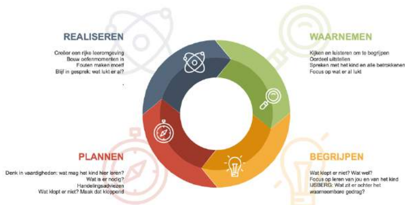
Figuur 2: Cyclisch HandelingsGericht Werken

Met het theoretisch kader van HandelingsGericht Werken in het achterhoofd, is onze belangrijkste focus in dit kader het cyclisch werken aan onderwijsverbetering op alle niveaus. Volgens de 4 fasen Waarnemen, Begrijpen, Plannen en Realiseren bezien we de processen op leerling-, groeps- en schoolniveau, waarbij de relatie tussen de 4 fasen van ontwikkeling en het voortdurende cyclische denken leidend is.