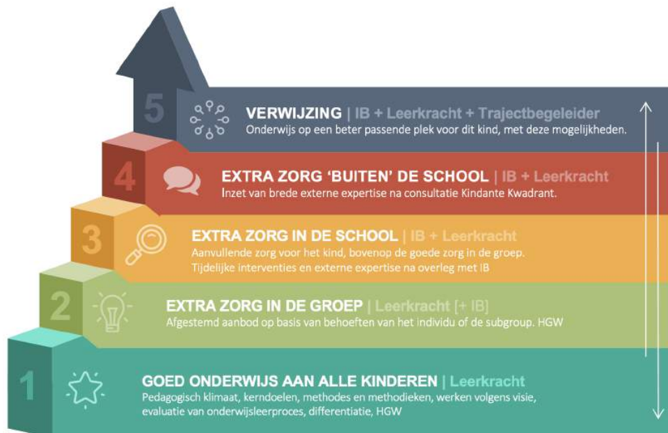
Figuur 1: Continuüm van Zorg

Basis van elke samenwerking binnen de school is het maken van goede samenwerkingsafspraken met externen over frequentie, tijdsduur en wijze waarop terugkoppeling naar school plaatsvindt. Via de volgende link meer info.