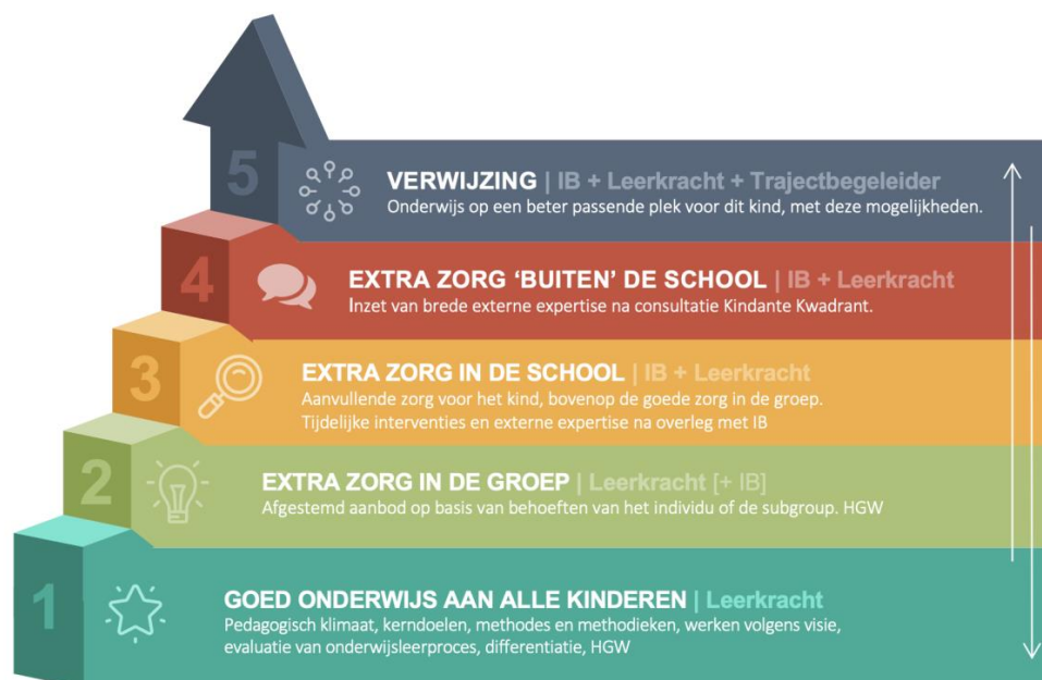
Figuur 1: Continuüm van Zorg

Basis van elke samenwerking binnen de school is het maken van goede samenwerkingsafspraken met externen over frequentie, tijdsduur en wijze waarop terugkoppeling naar school plaatsvindt. Via de volgende link meer info.