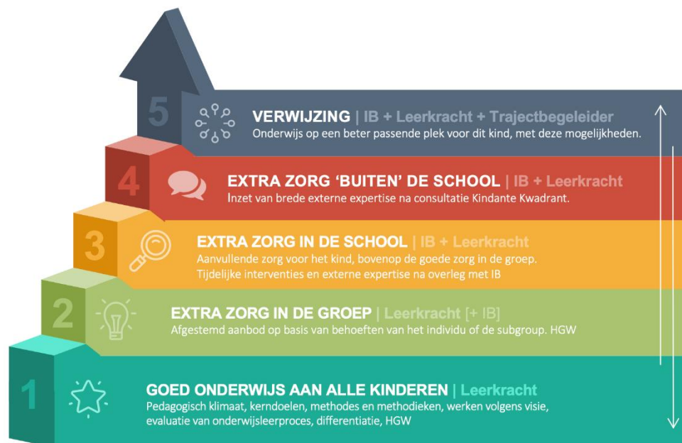
Figuur 1: Continuüm van Zorg

Basis van elke samenwerking binnen de school is het maken van goede samenwerkingsafspraken met externen over frequentie, tijdsduur en wijze waarop terugkoppeling naar school plaatsvindt. Via de volgende link meer info.